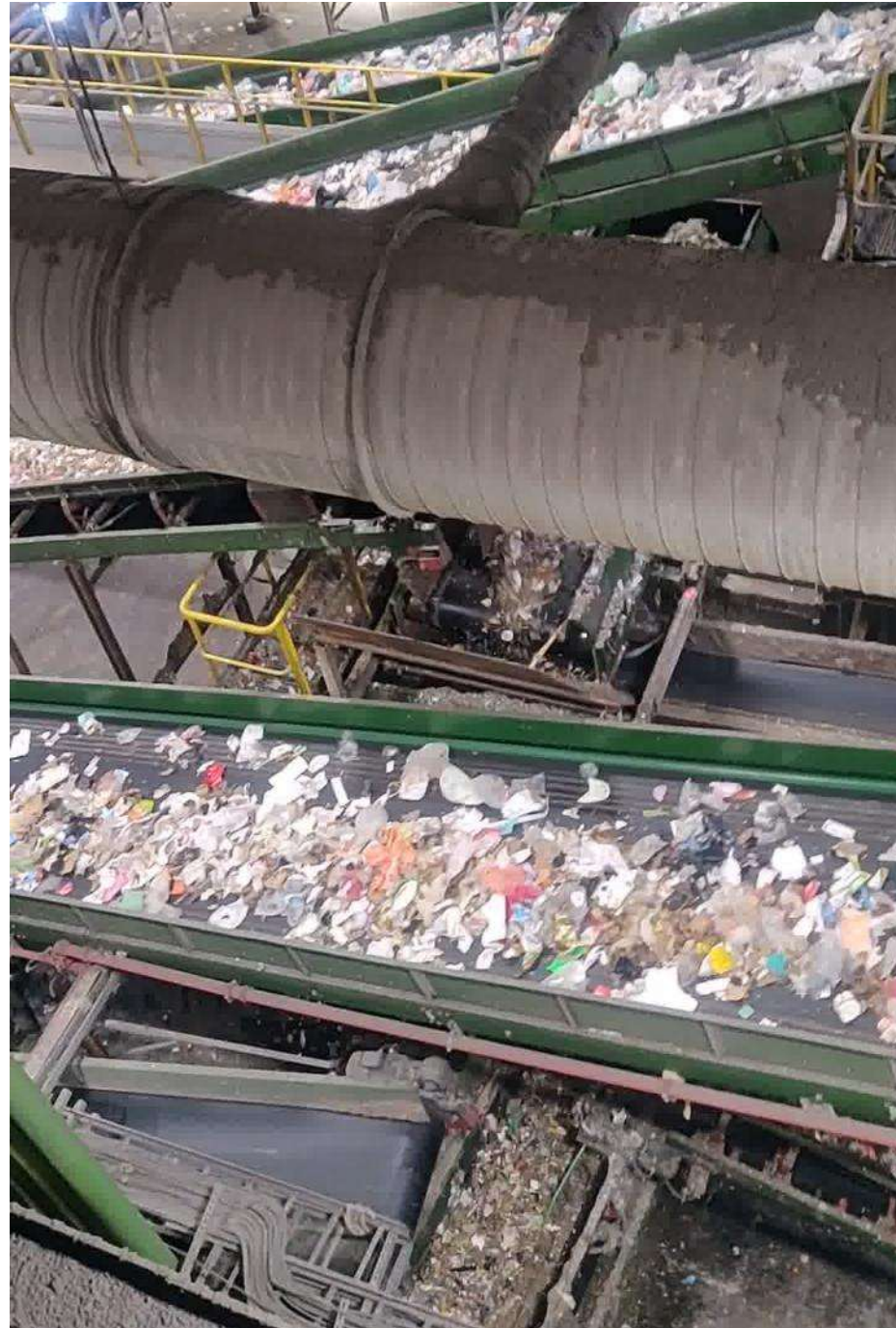
מפעל מיון פסולת, חירייה