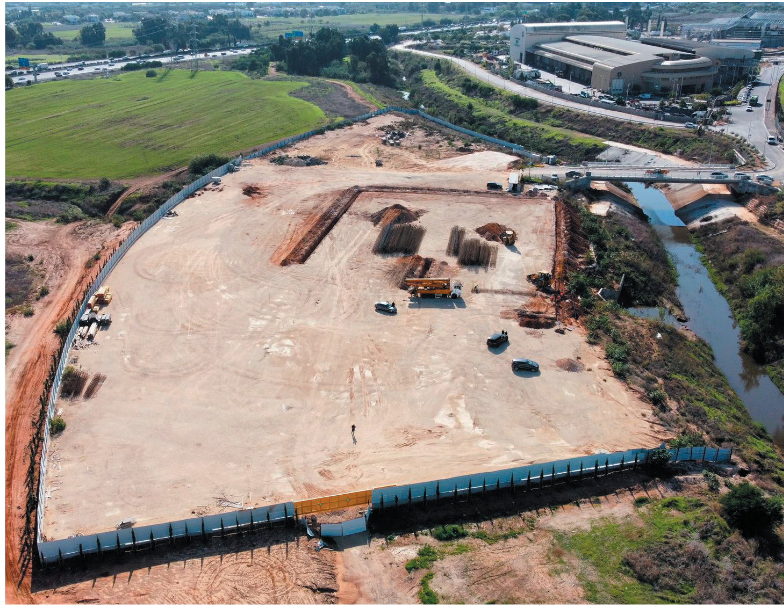
עבודות תשתית להקמת מפעל מחזור פסולה בניין