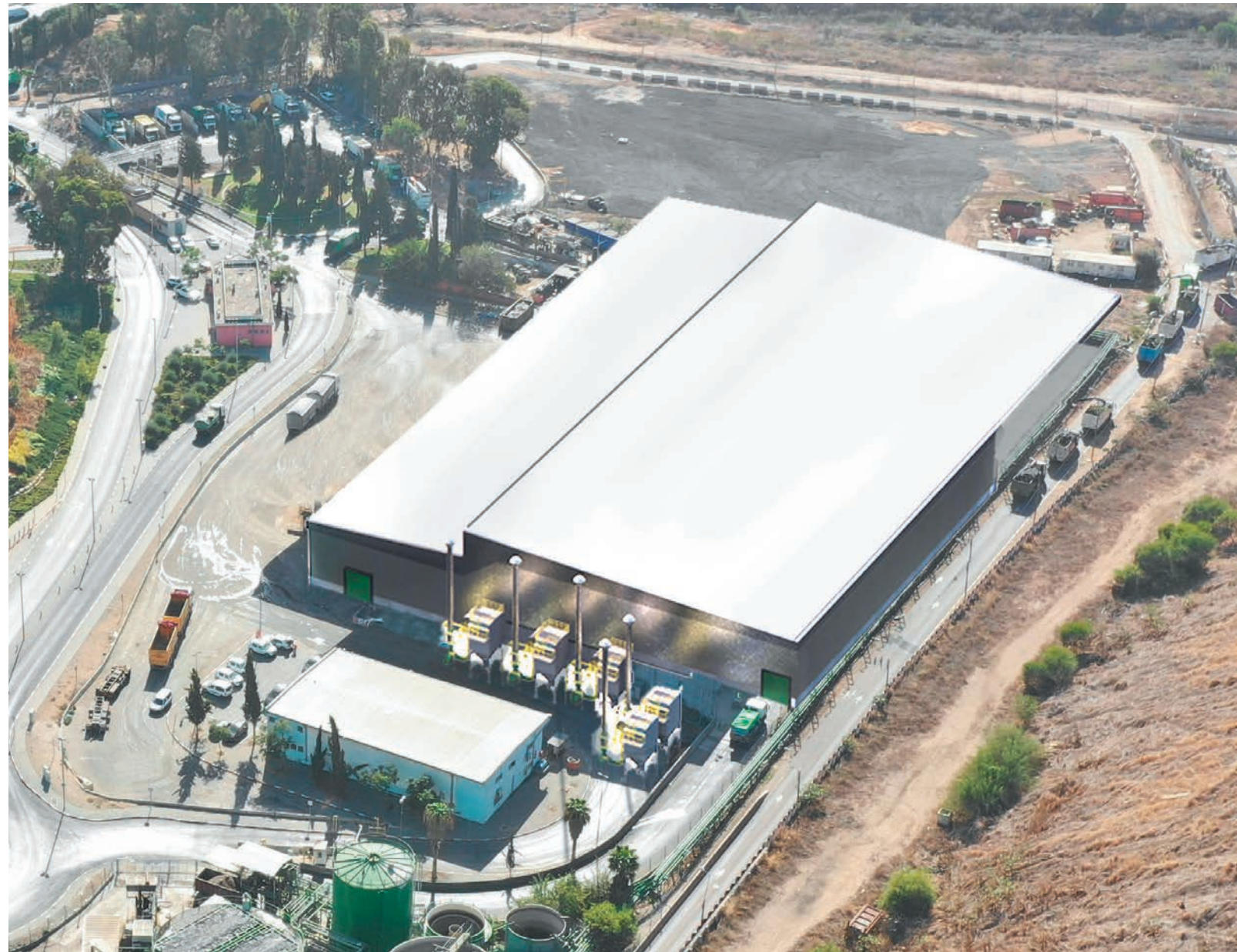
הדמיית מבנה תחנת המעבר המשודרגת