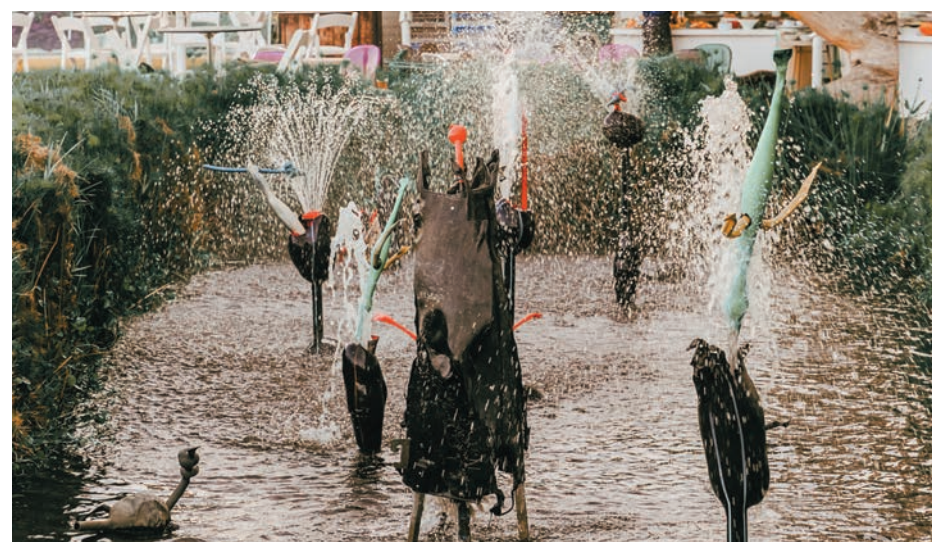
מזרקות חירייה, יואב שביט 2021