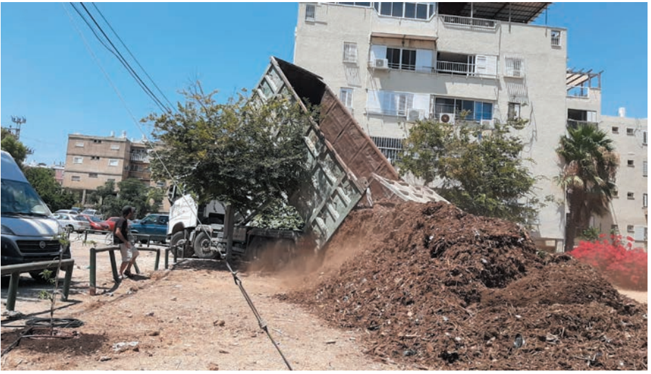
גזם גרוס מחירייה לשכונת שפירא במל אביב