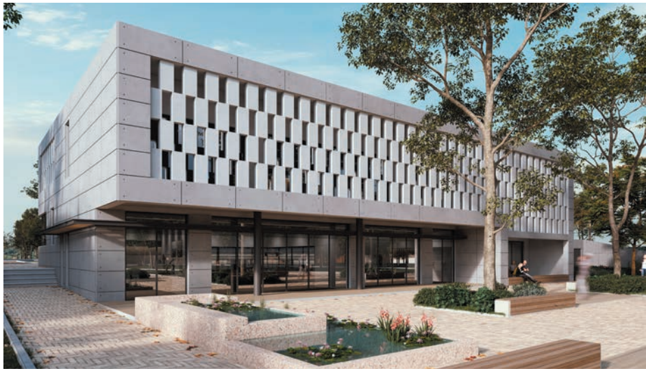
משרדי איגוד - הדמייה