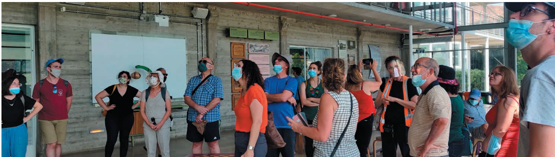
סיור מודרך למבקרים במרכז לחינוך סביבתי