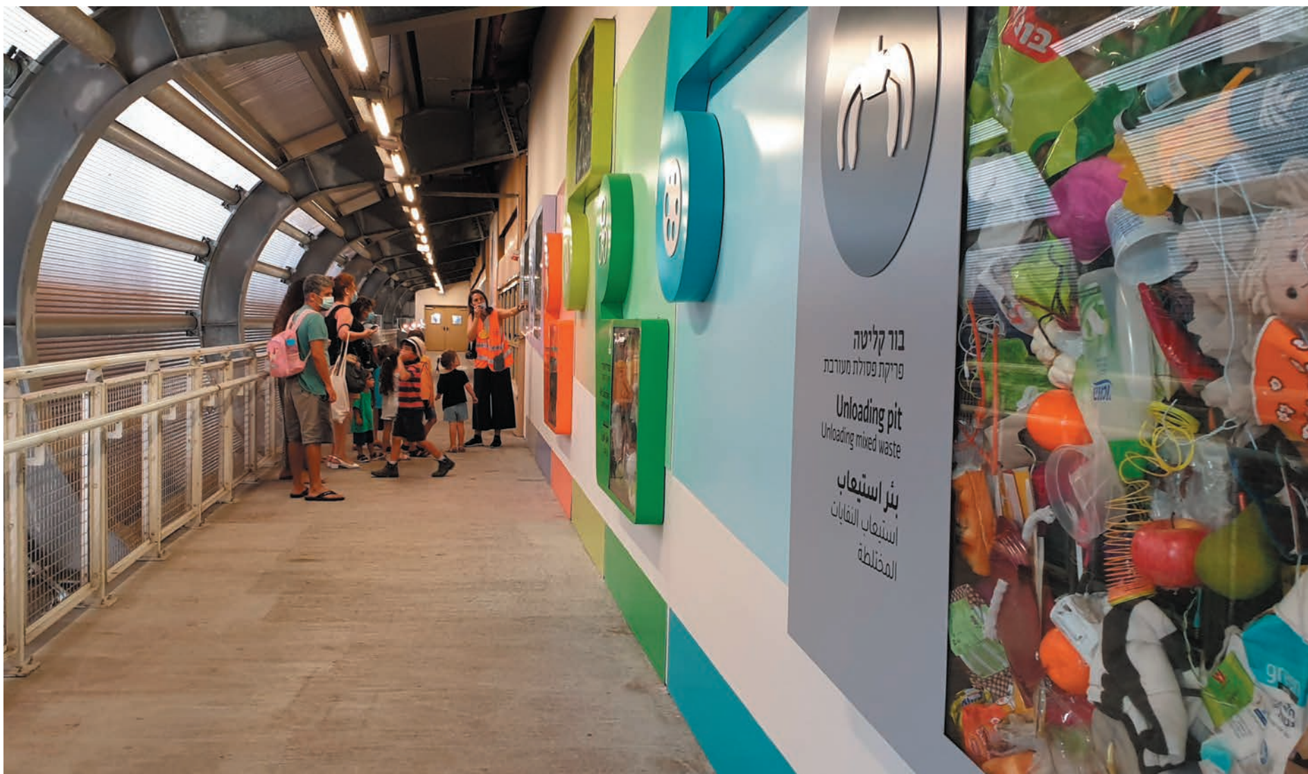
מדרג המבקרים, מפעל ה-RDF