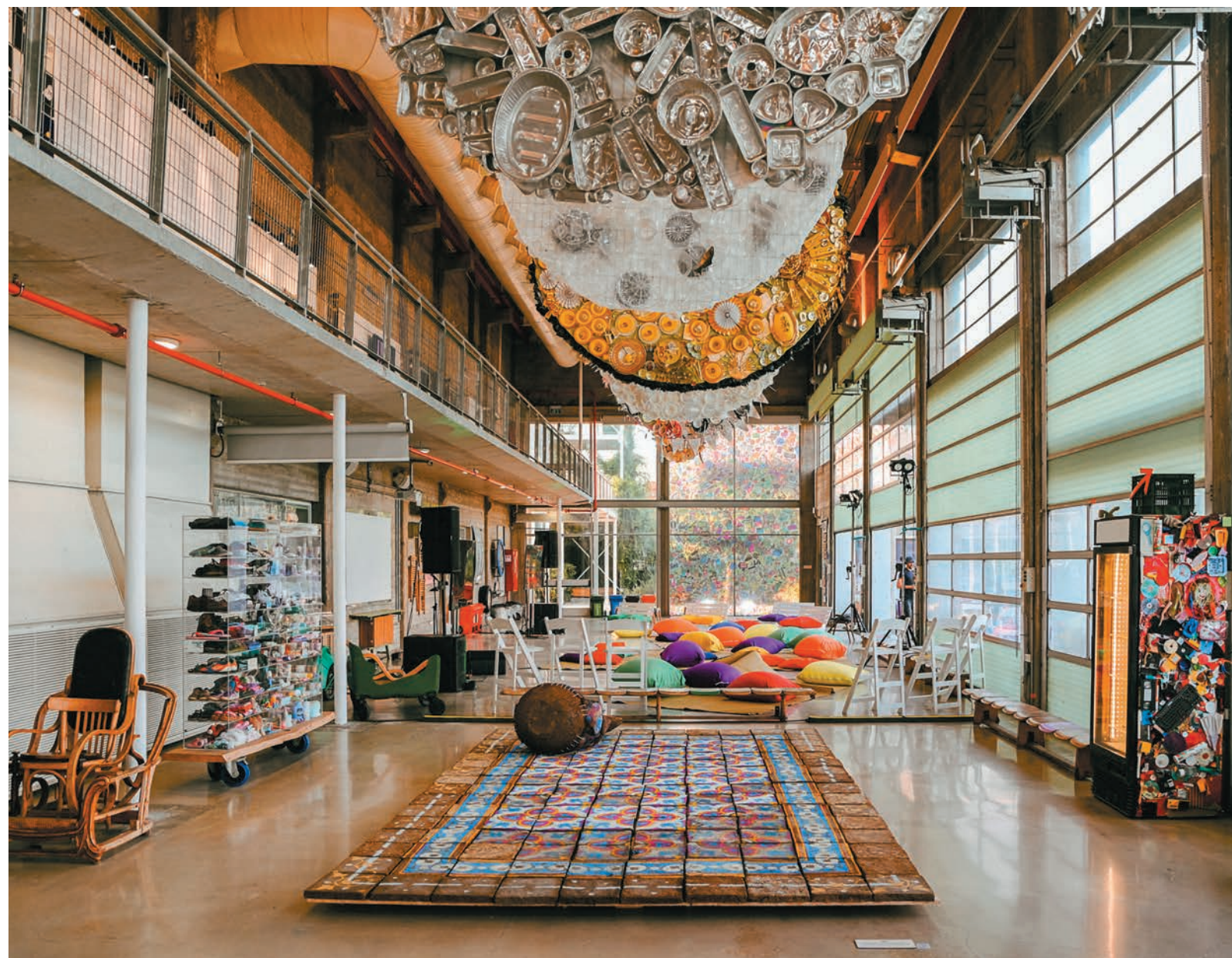
המרכז לחינוך סביבתי - תערוכת "שפע"