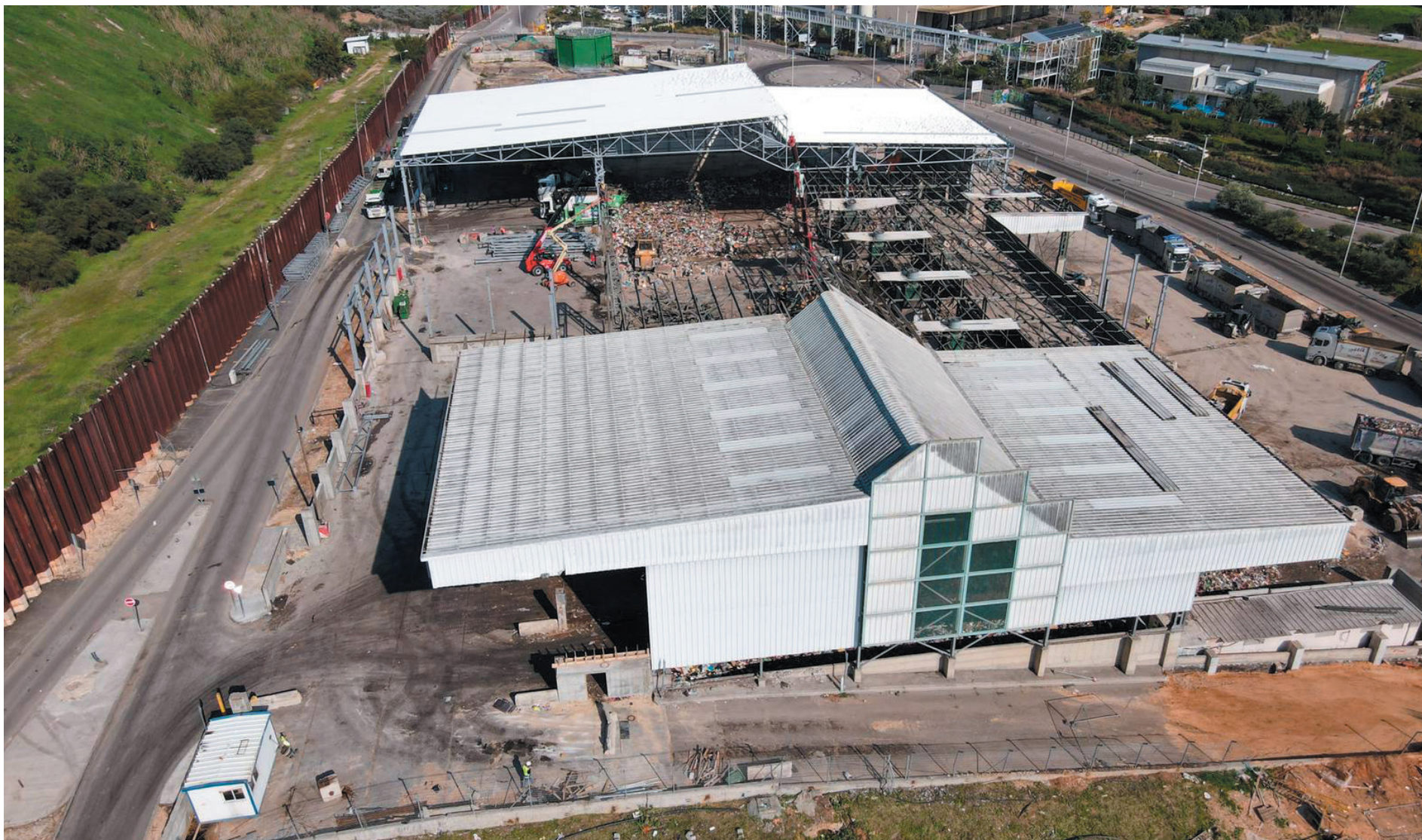
עבודות ביצוע בחחנת המעבר המשודרגת