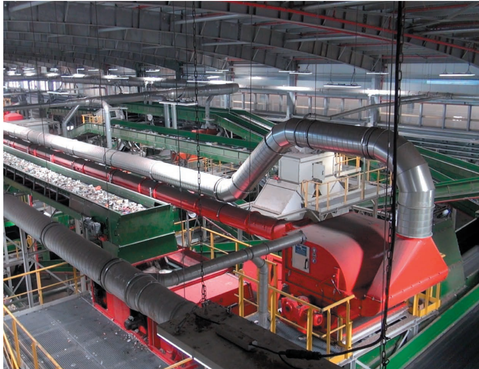
מפעל ה-RDF - הקמת קו מיון רביעי