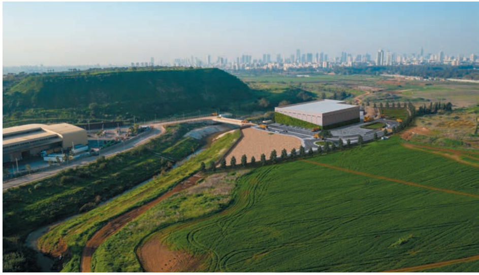
מתקן לטיפול בפסולת בניין - הדמייה